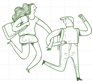
ALUMNES (infantil, primària i secundària)