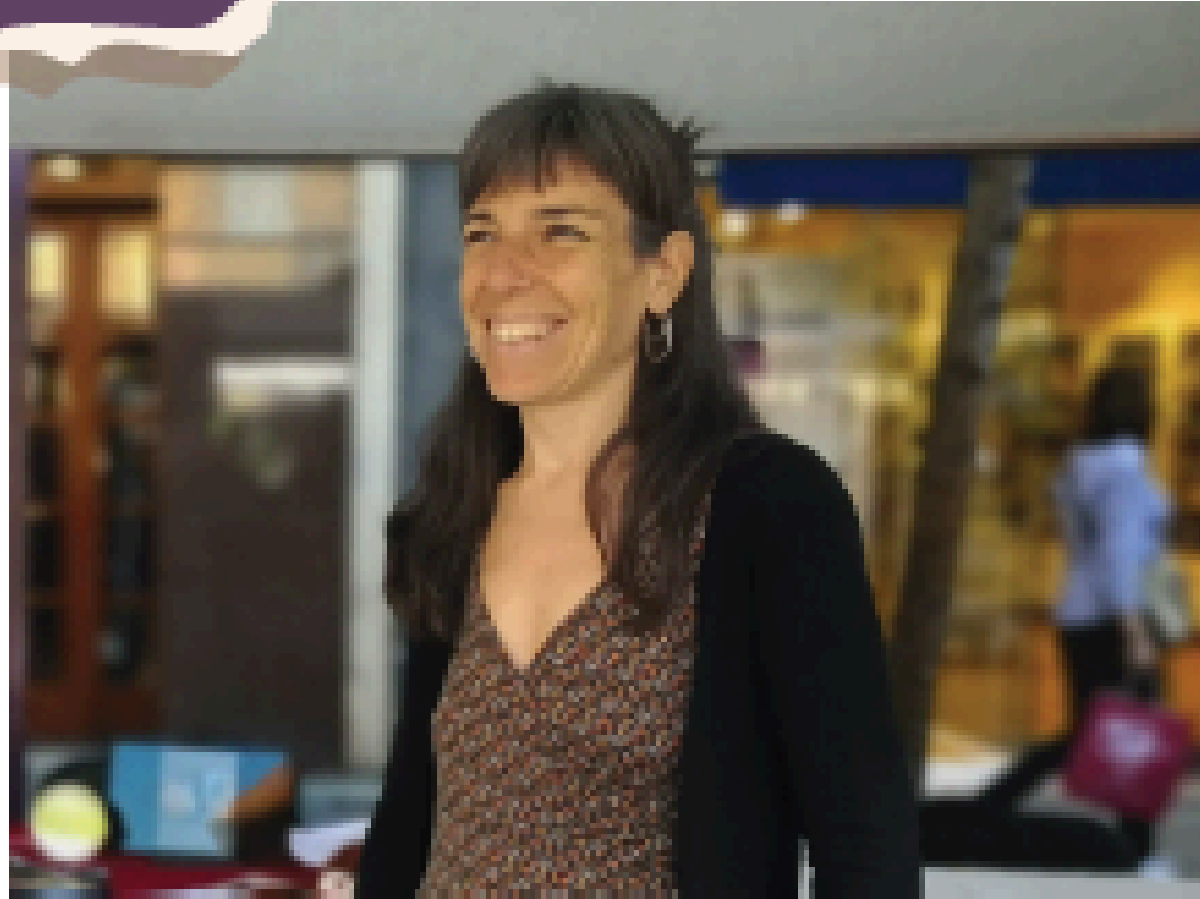
Formadora especialitzada en educació afectiva sexual