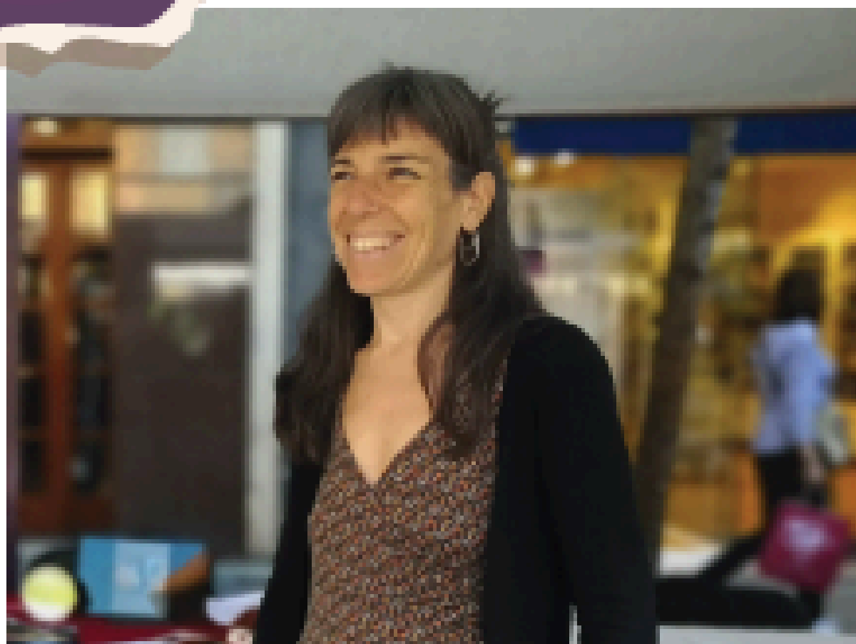
Formadora especialitzada en educació afectiva sexual